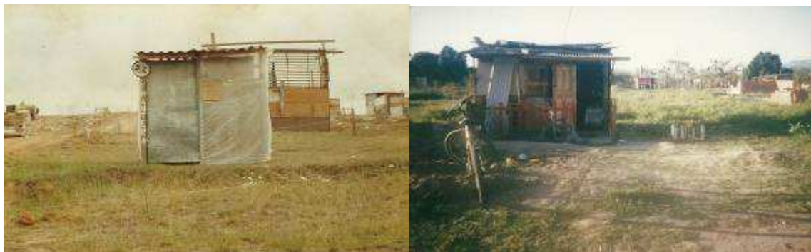
Figura 2 e 3 – Barracos temporários nos lotes demarcados, com piquete e barbante, na ocupação Parque Esperança.

Os parâmetros usados para definição do tamanho dos lotes procuravam contemplar as ampliações das moradias, que seriam executadas, no futuro, pelos moradores: “Olha bem, você tem uma família de dois ou três filhos, estes teus filhos vão crescer não vão? Ou eles vão fazer em cima da sua ou do lado, 120m 2 dá pra fazer uma casinha de 60m 2 e ainda sobra outros 60, e amanhã você pode comprar um carrinho e fazer a sua garagem, ou pode pegar um filho que não tem onde morar e colocar ali. E outra, hoje aconteceu isso, o que eu previa quando eu comecei, hoje muitas famílias já moram no próprio lote. Têm 2 ou 3 famílias ficando na sua própria casinha. Aquilo lá atrás valeu a pena” .