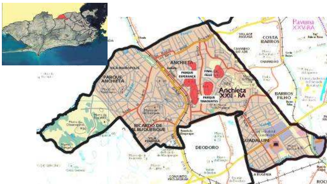
Figura 01: Em cima: o município do Rio de Janeiro com destaque em vermelho para a XXII RA composta por Parque Anchieta, Anchieta, Ricardo de Albuquerque e Guadalupe. Embaixo: localização das comunidades Parque Esperança, Final Feliz e Parque Tiradentes, em vermelho, no bairro de Anchieta.

Surgem, desse modo, loteamentos com 800, 1100 e até 1500 lotes, demandando intervenções do poder público, no sentido de promover a regularização da posse da terra, assim como a urbanização desses assentamentos. Alguns deles já existem há quinze anos e sua morfologia muito se assemelha às áreas vizinhas da cidade oficial, no que se refere aos padrões construtivos das moradias e nas dimensões dos logradouros. Contudo, devido à ausência de infra-estrutura de saneamento básico adequada, à ausência de pavimentação dos logradouros, bem como a situação irregular da propriedade fundiária, essas ocupações são consideradas assentamentos informais pelo poder público. Algumas das lideranças comunitárias que organizaram essas ocupações foram assassinadas ou estão desaparecidas. Outras ocuparam cargos eletivos nas Câmaras de Vereadores de seus municípios e na Assembléia Legislativa do Estado do Rio de Janeiro. Em alguns assentamentos, são raras as famílias que participaram do processo de luta pela terra, que ainda permanecem na comunidade. Embora não se tenha regularizado a posse da terra nesses assentamentos, lotes são comprados e vendidos, constituindo, assim, um mercado imobiliário à margem das normas e regras que norteiam essa prática na cidade formal.