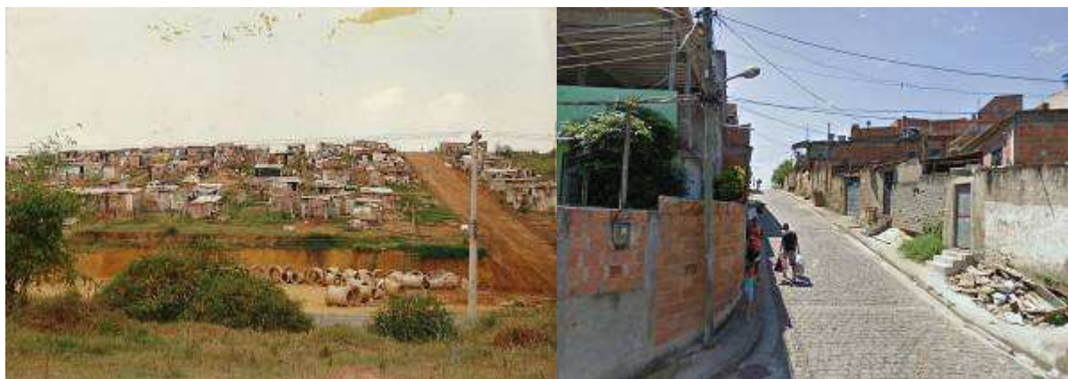
Figura 4 e 5 – Vinte anos separam a fase inicial das ocupações (1991 e 2010, respectivamente) e a implantação de infraestrutura que consolidou mais um bairro na região de Anchieta.

políticas habitacionais implementadas pelo poder público que contemplassem as demandas dessa população excluída do mercado imobiliário formal e, por último, a apropriação de um imóvel desocupado, que não cumpria uma “função social” de acordo com o estabelecido na Constituição de 1988.